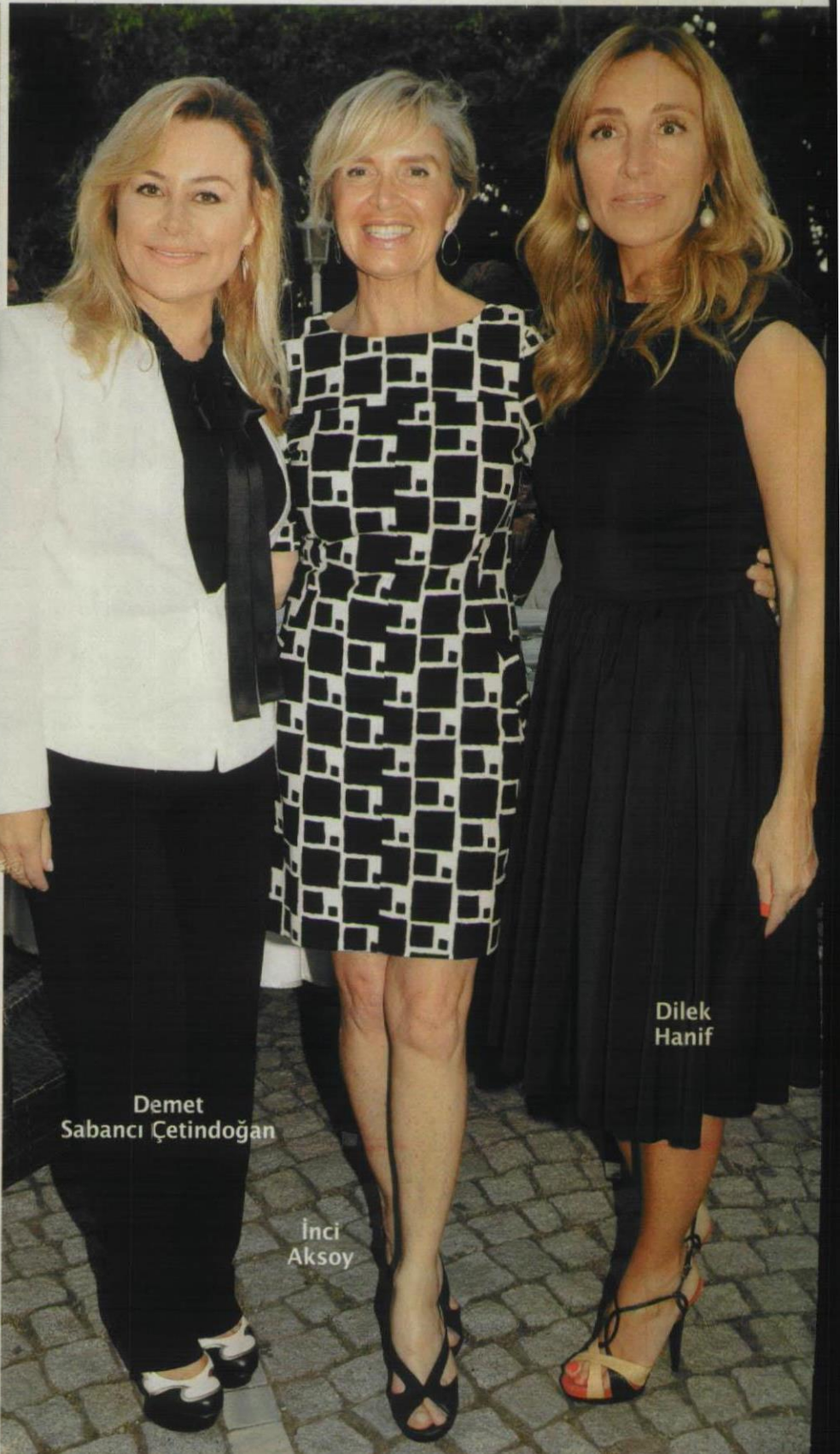
Demet Sabancı Çetindoğan