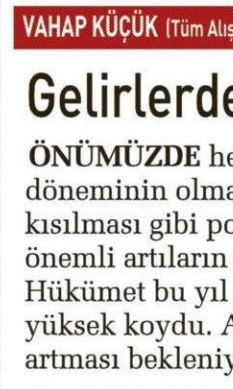
VAHAP KÜÇÜK (Tüm Alışveriş Merkezleri ve Perakendecileri Federasyonu Başkanı)

TÜRKİYE'NİN 2013 yılını yüzde 4.2 büyüme oranıyla kapatmasını bekliyoruz. 2014 ise bu yıldan farklı olmayacak. Önümüzdeki dönem içerisinde döviz konusunda kötümser değiliz. Türkiye şu anda dünyaya ihracat yapıyor. Gaziantep olarak ise 177 ülkeye ihracat yapıyoruz. İhracat artarak devam edecek.