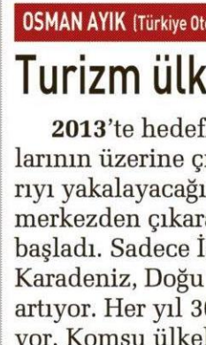
OSMAN AYIK (Türkiye Otelciler Federasyonu Başkanı)

İHRACATI 2013'te 17.5 milyar dolarla kapattık. Bu yıl ise yüzde 10 büyüme hedefliyoruz. Alım grupları kurdaki artışın etkisiyle siparişlerini artıracaktır. İç piyasada ise yüzde 5'lik büyüme bekliyoruz.