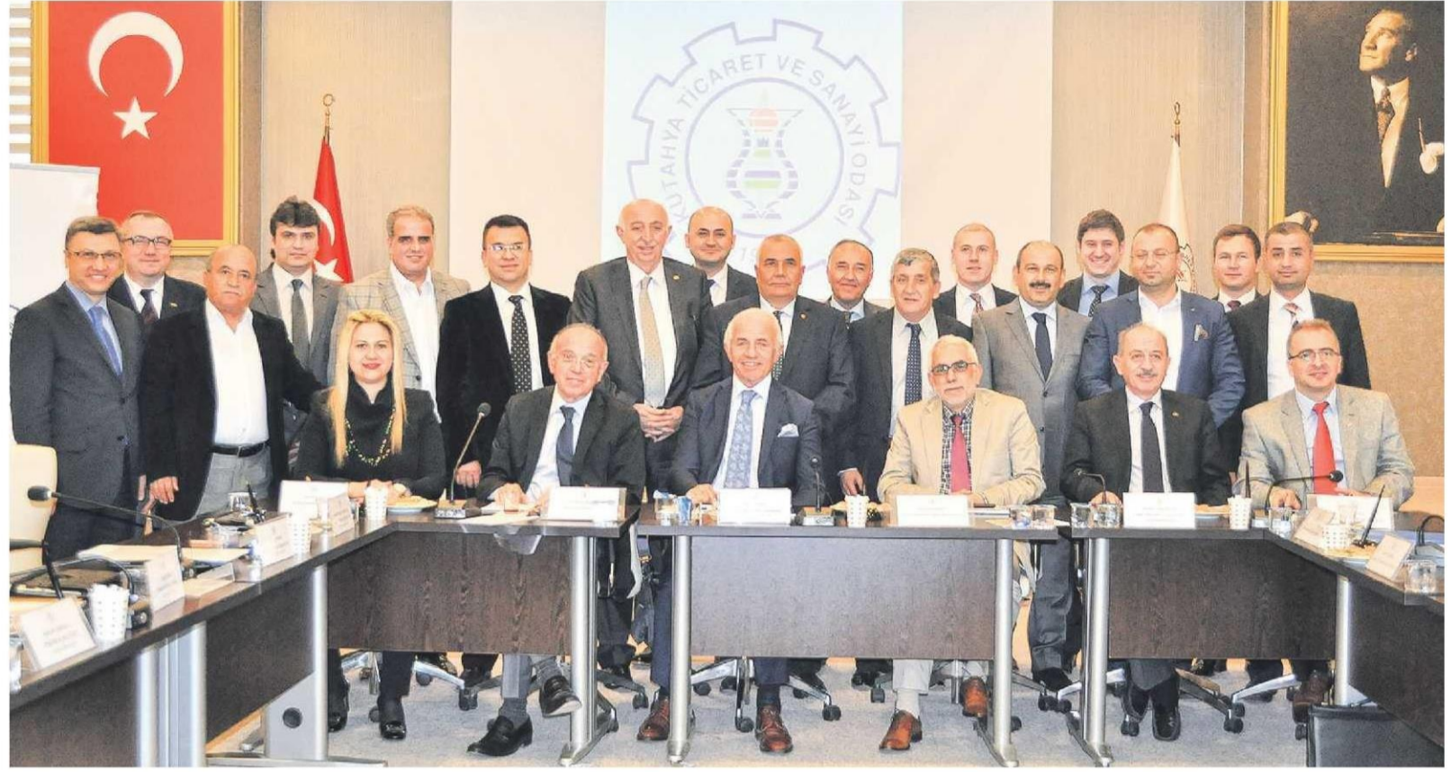
DÜNYA Gazetesi'nin "Üreten Kentler Anlatıyor" dizisi kapsamındaki toplantıların sonuncusu, Kütahya'da, KUTSO'nun ev sahipliğinde gerçekleşti.