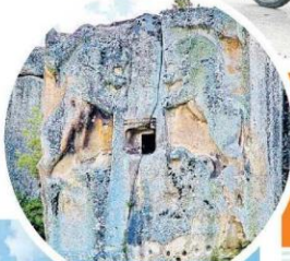
Binlerce yıllık doğal ve tarihi güzellikler keşfedilmeyi bekliyor.